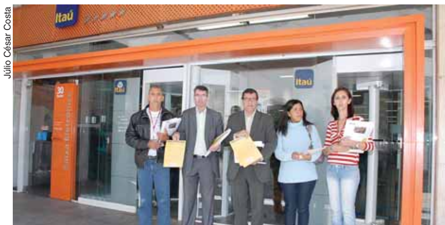
Dia de Luta: diretores distribuem carta no Itaú

“A fusão do Itaú e Unibanco, em 2008, elevou a instituição financeira das famílias Setúbal, Vilella e Moreira Salles ao primeiro lugar no ranking dos bancos privados; em 2010, lucrou R$ 13,3 bilhões, o maior do país e da América Latina. Essa exuberância financeira, no entanto, não é motivo de comemoração; pelo contrário. Para galgar o topo dentro do sistema privado nacional, o Itaú Unibanco sugou e continua sugando o que define como ‘colaboradores’; na verdade, trabalhadores bancários. A valorização daqueles que contribuíram e contribuem para o crescimento da instituição inexistente. Em nome de se adequar à nova realidade interna e do mercado, ao novo padrão de produtividade, explora, abusa e descarta pessoas como se fossem objetos obsoletos. Nem mesmo recicla. Demite descaradamente; inclusive aqueles que se dedicaram durante anos para a solidez financeira da instituição. Abusa porque não oferece condições dignas de trabalho, não respeita nem mesmo a jornada de trabalho; em algumas agências,