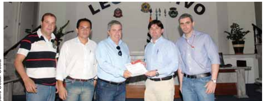
Monte Mor: Sindicato entrega projeto ao presidente da Câmara

delo de projeto de lei em oito cidades (Mogi Mirim, Nova Odessa, Estiva Gerbi, Hortolândia, Mogi Guaçu, Elias Fausto, Monte Mor e Amparo). Nesta