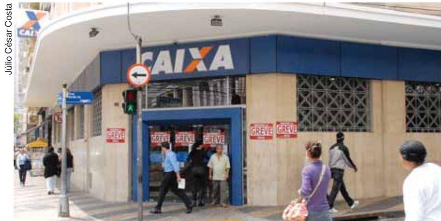
Greve durante a Campanha Nacional 2010