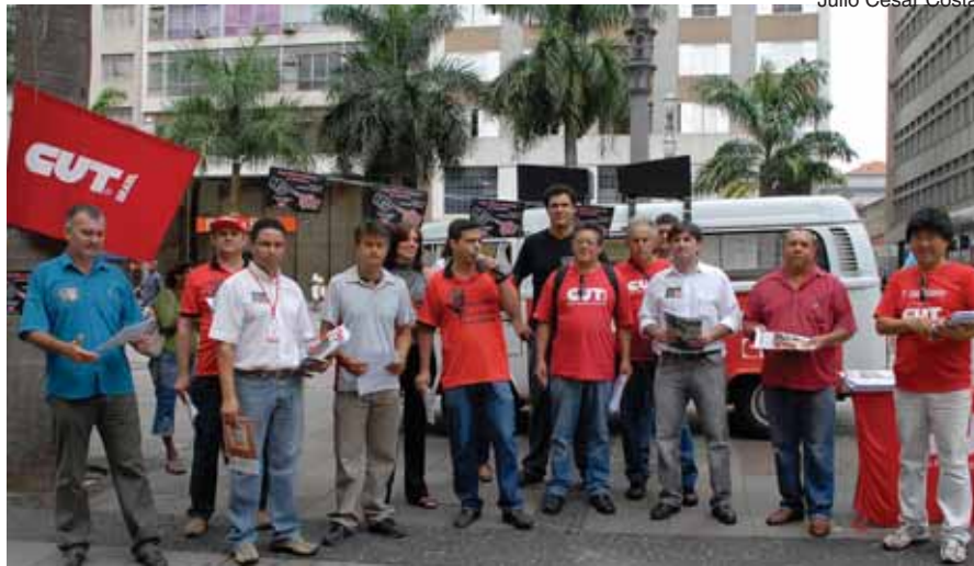
Diretores do Sindicato durante ato público no centro de Campinas