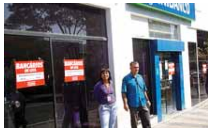
Agência Senador Saraiva