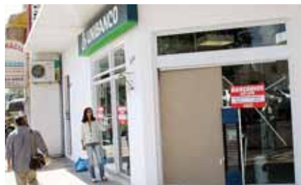
Agência Paula Bueno